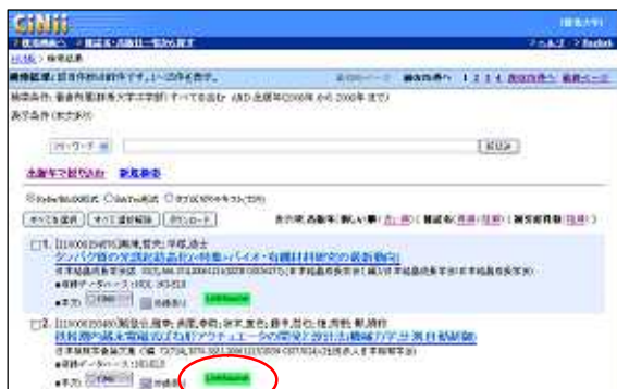
[ CiNii ]

データベースを検索した際、その電子ジャーナルが群大で見られるかどうか、すぐに分かります。群大に電子ジャーナルがない時、ダイレクトに Google Scholar を検索できます。Google Scholar でもヒットしない時、冊子体が群大図書館にあるかどうか、OPAC をダイレクトに検索できます。冊子体がなく、文献コピーを取り寄せたいとき、[ 文献複写依頼 ] というリンクをクリックすると、論文名・著者名などをデータベースから自動的に取り込めます。