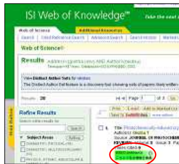
[ Web of Science ]